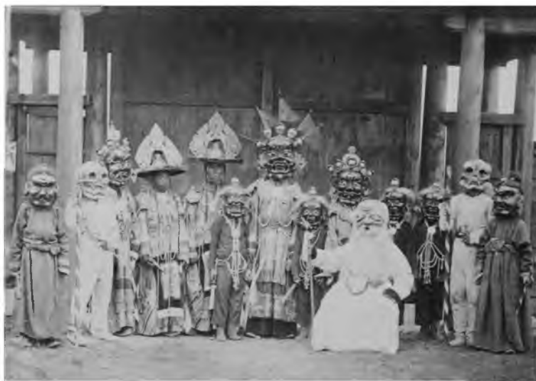
Рисунок 4. Ламы в масках и костюмах, участвующие в религиозном ритуале (цам) в Гусиноозёрском дацане

Согласно различным источникам, основной центр изготовления масок был в главных монастырях Монголии. Сохранились имена наиболее известных мастеров: Шамбон (Чамбон) Пунцаг-Осор, известный художник и скульптор провинции Барга; Ёндон провинции Намдлинг; Джагдер провинции Зугой; Лувсанцэрен, выдающийся мастер изготовления восковых форм, и другие.