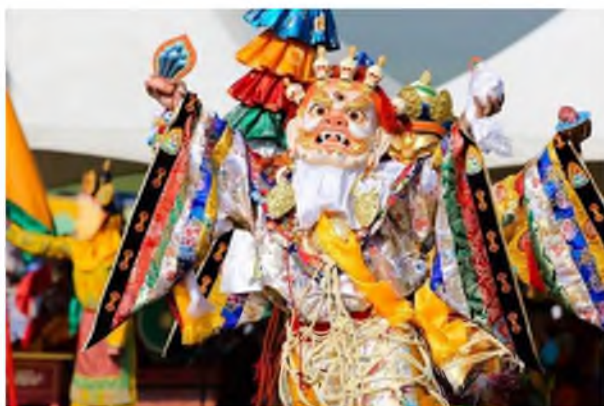
Рисунок 1. Типичный костюм церемонии цам в Монголии

главная идея танца цам заключается в победе над религиозным врагом [6].