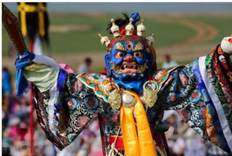
Рисунок 3. Гомбо Махагал – великий защитник

Маска цам является основным инструментом для изображения облика свирепых богов, а также природных объектов – гор и рек. В зависимости от характера персонажа маски богов могут быть черными, синими и красными. Например, те, кто борется с еретиками и грешниками, имеют чёрные маски.