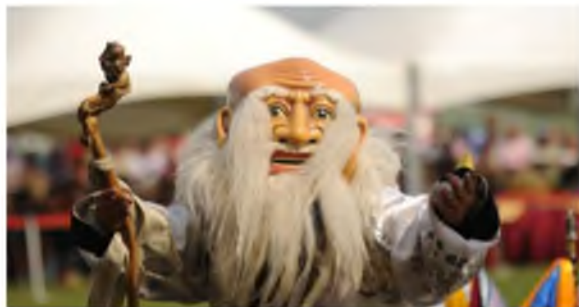
Рисунок 2. Белый старец

Хад, чтобы попытаться увидеть цама, где главным героем был Белый старец. В характере танца и в costume зрители пытались угадать, какой будет зима в этом году. Если ламы-астрологи полагали, что зима ожидается хорошей, то главный герой был дружелюбен, играл с детьми. Если же наоборот, то Белый старец был в пантомиме коварным и агрессивным [7].